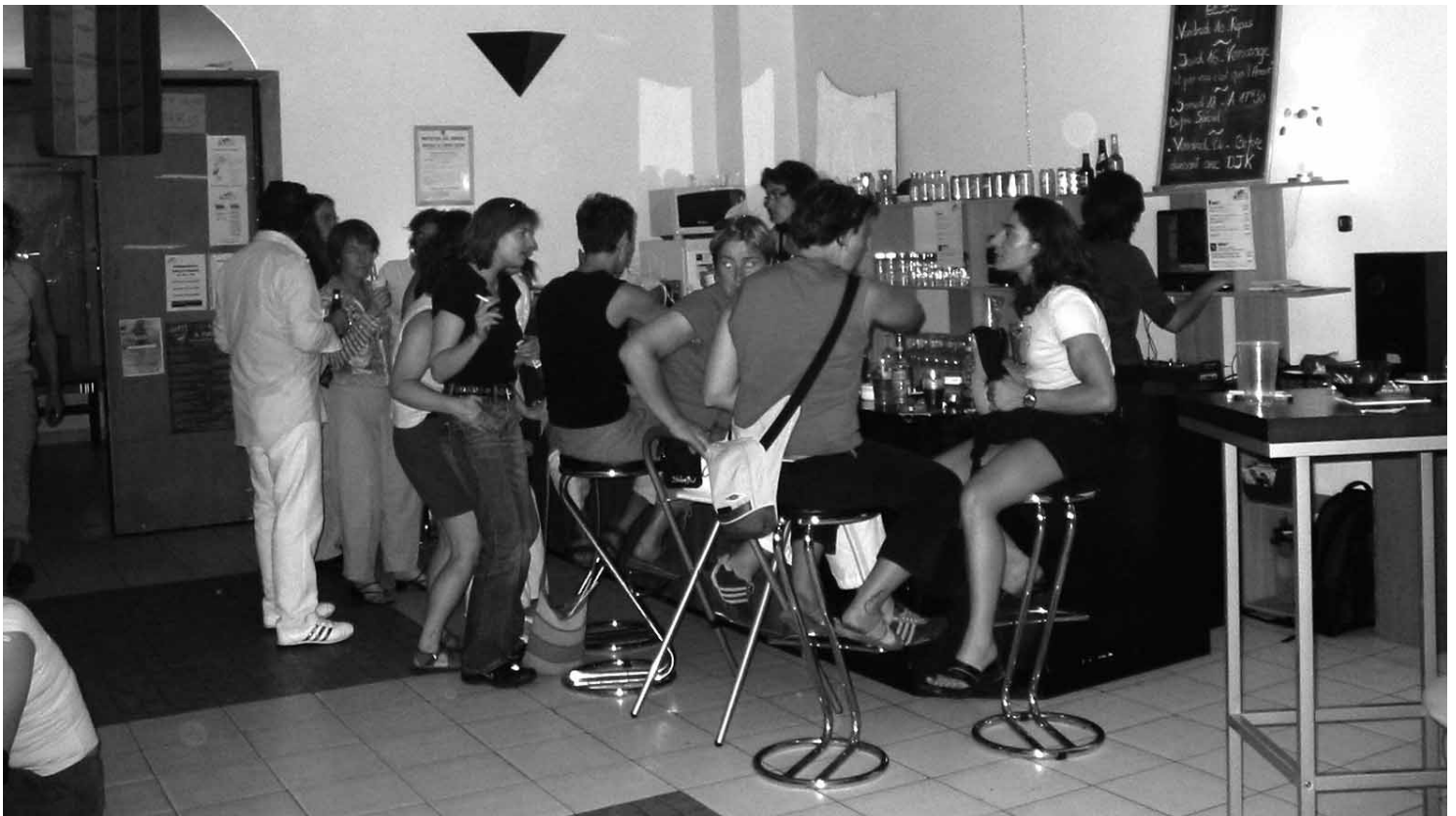
Samedi 18 juin 2005 - Permanence mixte après la marche de la Lesbian and Gay Pride

Cette photo illustre bien la convivialité de l'association et le retour de la fréquentation depuis ces nouveaux locaux. Preuve que notre association est encore bien nécessaire. Nous avons vécu des périodes difficiles (Engagement pour le Pacs, Action en Justice, Dégradation des anciens locaux, Négociations pour notre départ, Recherche de locaux, Déménagement, etc.). Nous sommes donc fatigué(e)s. Je ne renouvellerai pas mon mandat. La relève se fait sentir au sein de l'équipe. Je souhaite fortement qu'elle soit là, à la prochaine AG (dans 4 mois...) Je vous invite à y penser et à venir nous aider pour préparer cet avenir.