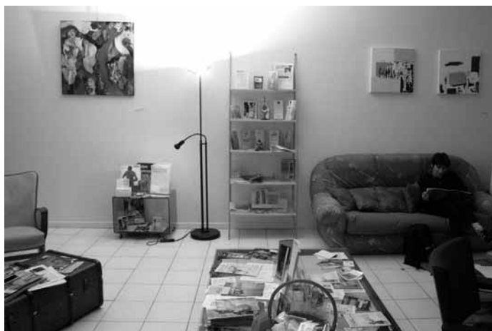
Edition accroche-coeur n°1