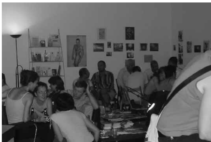
Edition accroche-coeur n°2