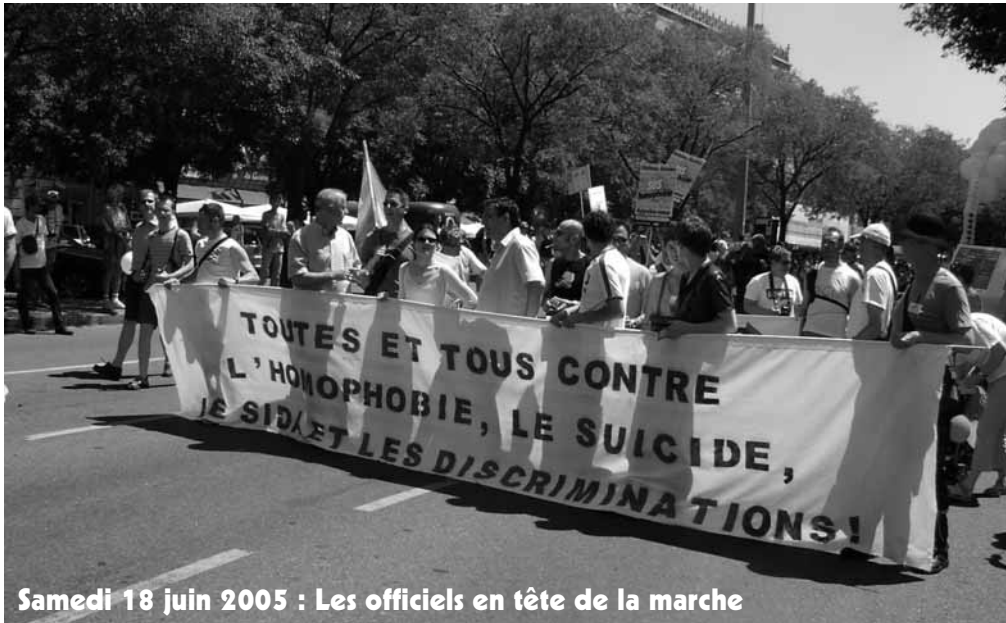
Samedi 18 juin 2005 : Les officiels en tête de la marche

Nous étions environ 6000 à défiler ce 18 juin dernier, sous un beau soleil. Il va sans dire que nous espérons un peu plus de monde. (Rapide calcul, en comptant seulement 10 % de gays et lesbiennes dans la