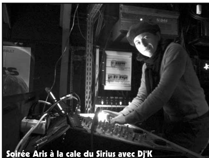
Soirée Aris à la cale du Sirius avec Dj'K

Nous n'avons cependant pas encore trouvé de solution pour refaire des soirées dansantes, sachant que les propriétaires de la Cale du Sirius ne veulent plus refaire de location. Nous allons faire des soirées au local, vraisemblablement sous une forme un peu différente... soirées mecs, soirées filles et deux ou trois "gais tea-danse" mixtes le dimanche après-midi. Surveillez notre site et notre répondeur... (infos page 11)